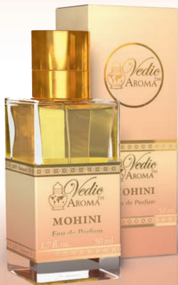
50 ml spray bottle