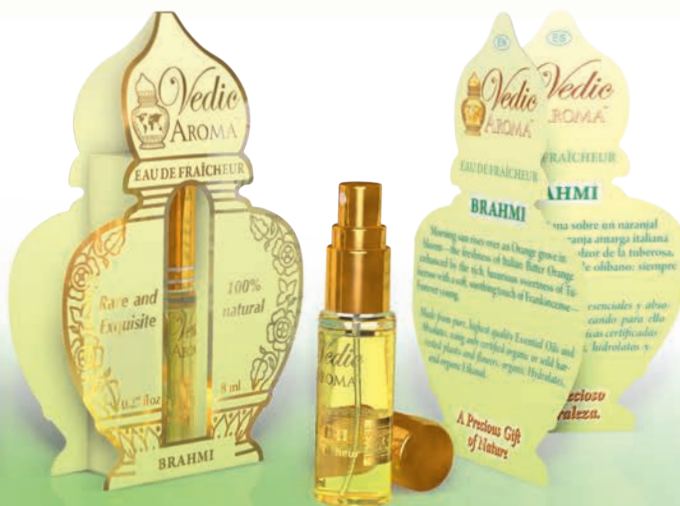
8 ml spray bottle boxed with Kalash card in four languages