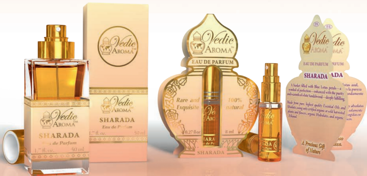
50 ml spray bottle