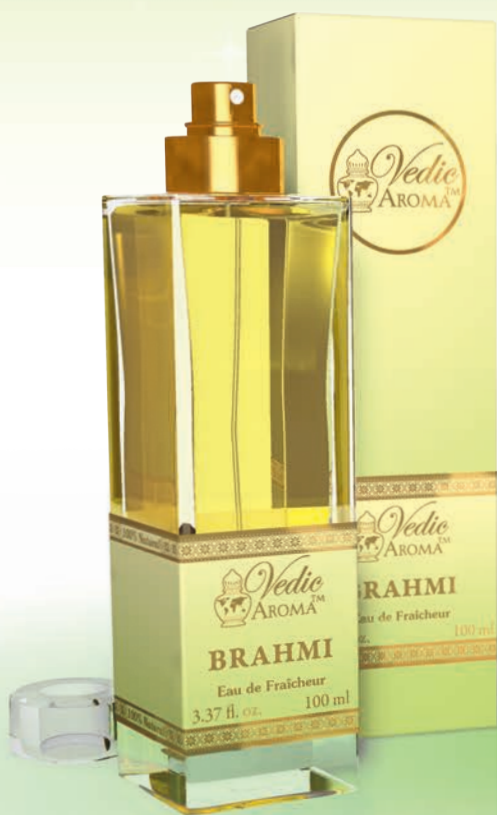
100 ml spray bottle