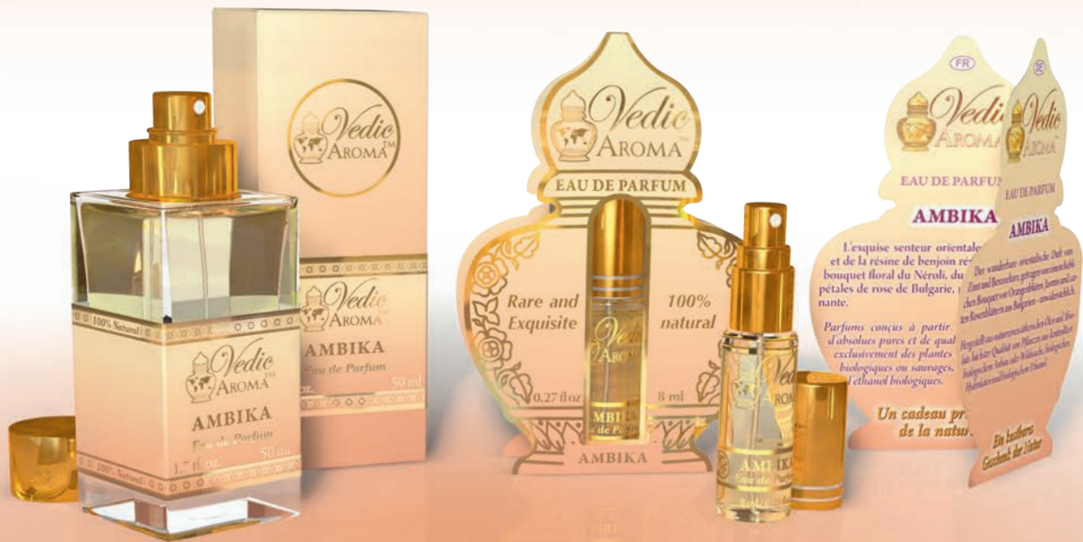
50 ml spray bottle