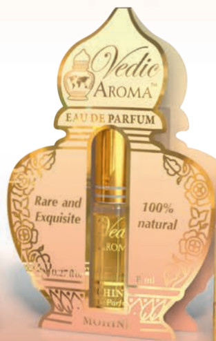
8 ml spray bottle boxed with Kalash card in four languages