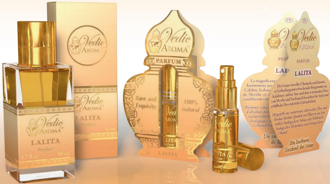
50 ml spray bottle