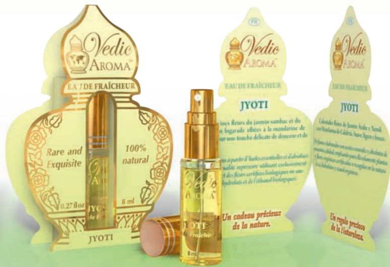
8 ml spray bottle boxed with Kalash card in four languages