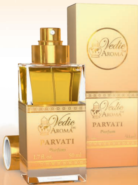
50 ml spray bottle