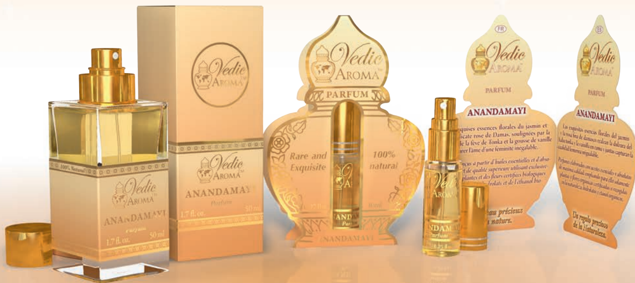
50 ml spray bottle