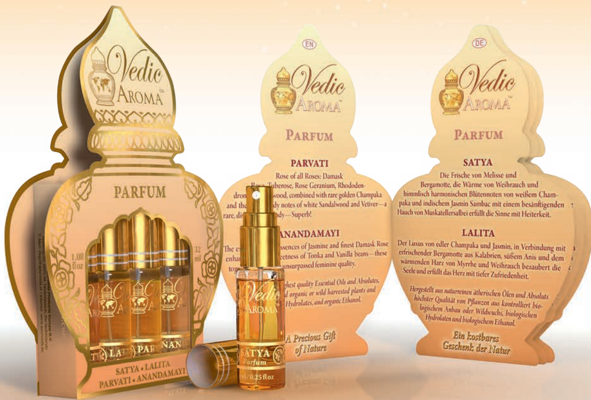
4 x 8 ml spray bottles