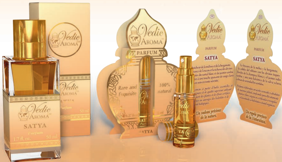
50 ml spray bottle