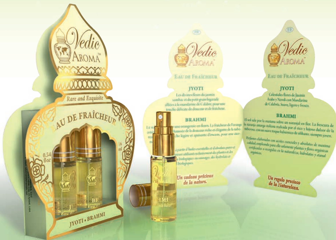
2 x 8 ml spray bottles