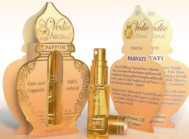
8 ml spray bottle boxed with Kalash card in four languages