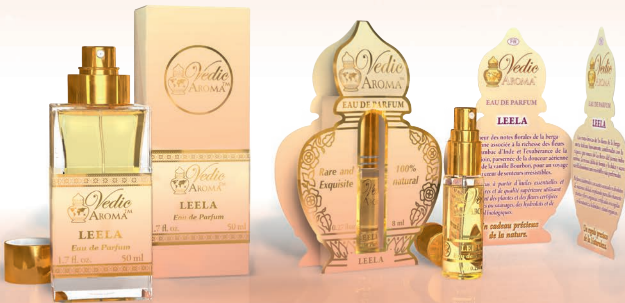
50 ml spray bottle