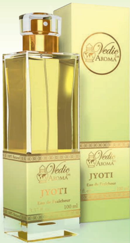
100 ml spray bottle